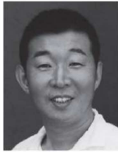
鄭 義信 (ちよん ういしん) 脚本・演出家

兵庫県姫路市出身。93年に『ザ・寺山』で第38回岸田國士戯曲賞を受賞。08年に上演された日韓共同制作の『焼肉ドラゴン』は読売演劇大賞、朝日舞台芸術賞、芸術選奨文部科学大臣賞、紀伊國屋演劇賞など数々の演劇賞を総なめにした。その一方、映画に進出して、同年、『月はどっちに出ている』の脚本で、毎日映画コンクール脚本賞、キネマ旬報脚本賞などを受賞。98年には、『愛を乞うひと』でキネマ旬報脚本賞、日本アカデミー賞最優秀脚本賞、第一回菊島隆三賞、アジア太平洋映画祭最優秀脚本賞など数々の賞を受賞した。さらに平成13年度芸術祭賞大賞受賞ほか受賞した『僕はあした十八になる』(01/NHK)などテレビ・ラジオのシナリオでも活躍する一方、エッセイ集『アンドレアスの帽子』なども出版。現在も、〈文学座〉〈こんにゃく座〉ほかに戯曲を提供する傍ら、自身が作・演出を努める劇団〈ヒトハダ〉を来春旗揚げ予定である。2014年に紫綬褒章を受賞。